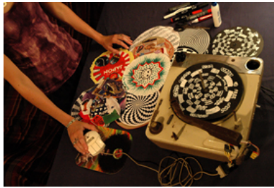
ON! (Orgullosos Nerds)